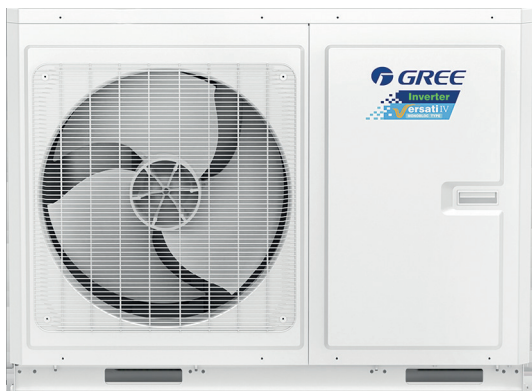
Versati IV condensing unit